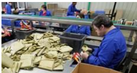
L'atelier Louis Jaffrin de Les Platieres (69).

Bruno Le Maire, le ministre de l'Economie a estimé qu'avec la baisse du chômage, le gouvernement pourrait baisser les aides à l'emploi...La prime d'activité, ou encore les contrats aidés sont dans le viseur