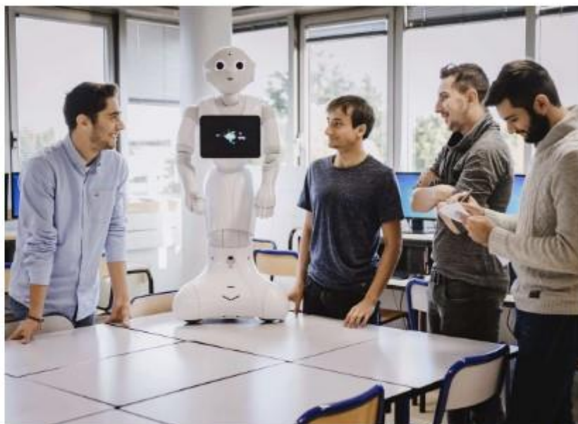
Les visiteurs du salon Viva Tech pourront faire connaissance avec un robot-enseignant, qui apprend aux enfants de la maternelle à reconnaître les animaux, mis sur pied dans les Yvelines au Centre de formations industrielles (CFI).

Attirer les talents, se financer, construire son identité numérique... Plusieurs ateliers rythmeront la journée de jeudi. De 11 h 30 à 12 heures, puis de 15 heures à 15 h 30, le « workshop » intitulé « Comment accélérer sa croissance grâce à un mentorat » permettra à la CCI de faire connaître son Institut du mentorat entrepreneurial (IME), dont elle est à l'initiativ