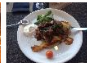
Visite de l'Inkubator de Jasionka