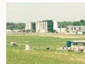
Viste de l'INKUBATOR de Jasionka

Vous irez visiter des entreprises de toutes dimensions et découvrirez des niveau d'équipements de tout premier ordre au niveau de la compétitivité et du modernisme