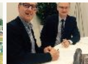
Signatures de Contrats...