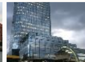
Le quartier des affaires de Varsovie