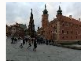
A Varsovie , l'économie est en plein essor

Un planning de rendez vous B to B vous sera organisé afin de vous permettre de mettre au point et définir nos prochains développements d'idées économiques. Grâce à l'appui de la chambre de commerce des différentes villes , vous pourrez trouver une place pour vos futurs investissements