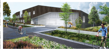
LOT G · EUROPARC MASSY