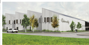
LOT E · URBAN VALLEY 2