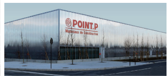
LOT AB · POINT P