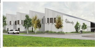
LOT E - URBAN VALLEY 2