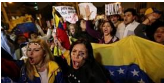
La manifestation géante du 2 septembre dernier

A partir du printemps 2016, les manifestations s'enchaînent chaque semaine à Caracas. Le 2 septembre dernier, ce n'est pas moins d' un million de personnes qui défilent dans les rues pour réclamer le départ de Nicolas Maduro.